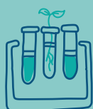
Sciences au labo

Votre enfant entre en CM2... nous lui proposerons, tout au long de l'année, une préparation à son entrée au collège !